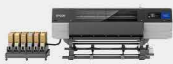
F10030H | 熱昇華紡織輸出機