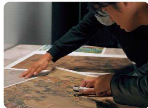
故宮典藏 feat.興台印刷 x 臻印藝術