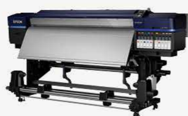
64吋雙噴頭十色廣告大圖輸出機