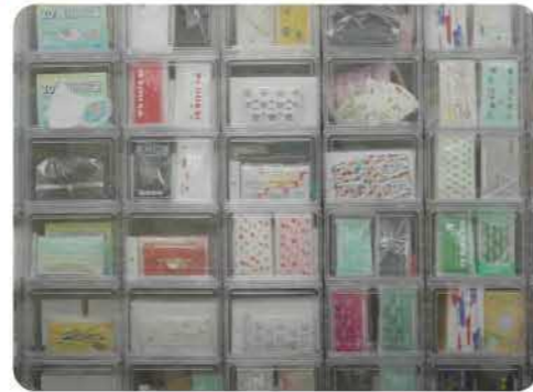
客製化口罩國家隊 feat.順易利口罩