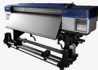
64吋單噴頭四色廣告大圖輸出機