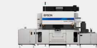
L6534VW | 數位噴墨標籤印刷機