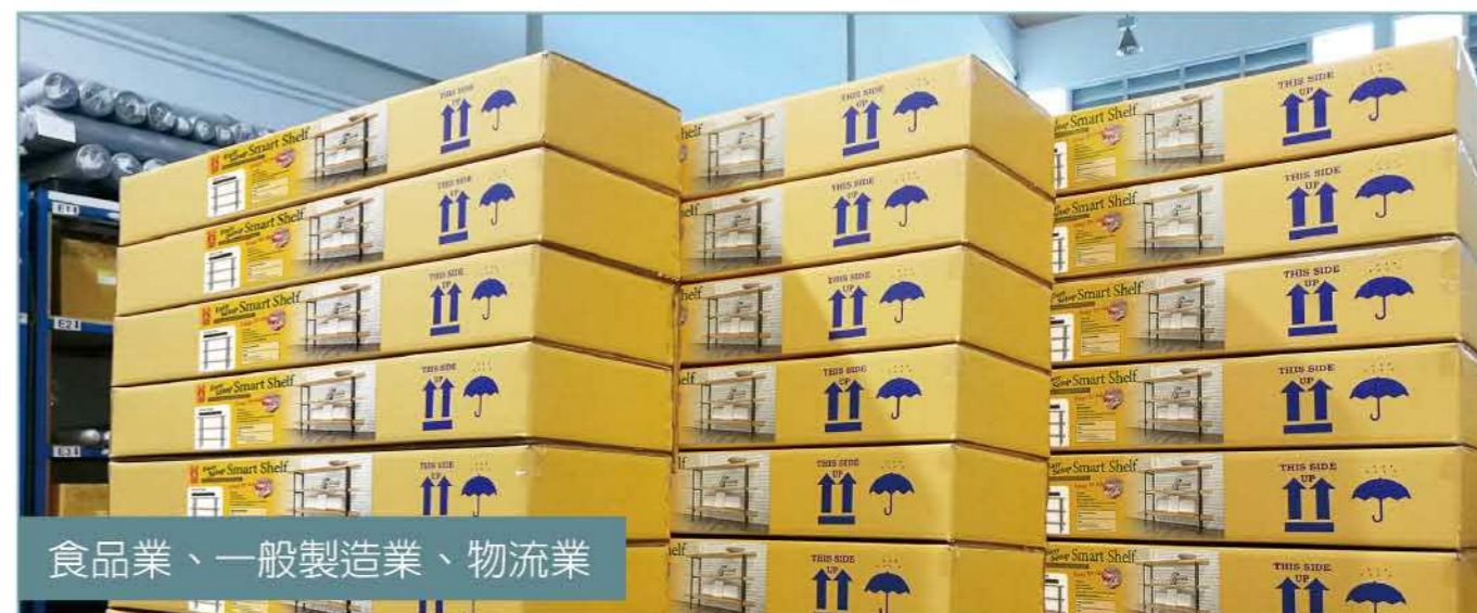
食品業、一般製造業、物流業