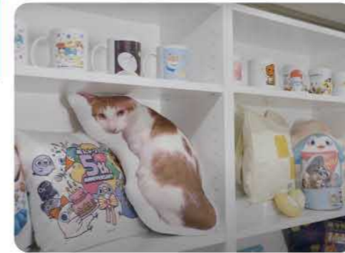
文創微噴打造高品質客製商品 feat.啟盛國際 BardShop