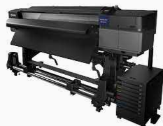
64吋大供墨四色廣告大圖輸出機