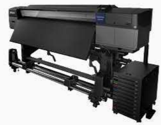
64吋大供墨十色廣告大圖輸出機