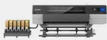
F10030H | 熱昇華紡織輸出機