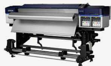
64吋雙噴頭四色廣告大圖輸出機