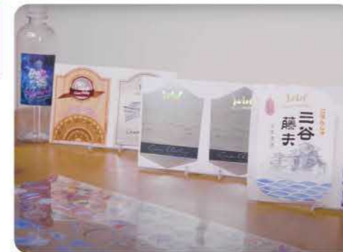
特殊標籤應用 feat.威利印刷 x 冠達彩藝