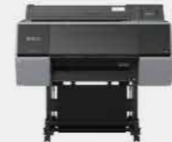
SC-P7530 | 12色高階影像繪圖機