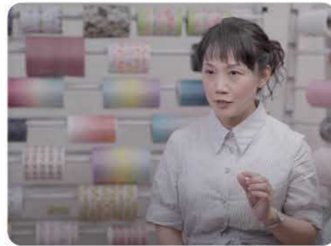
讓您安心使用的客製化口罩 feat.福綿纖維