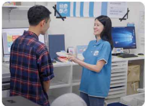
全臺代印店龍頭 feat.經典數位