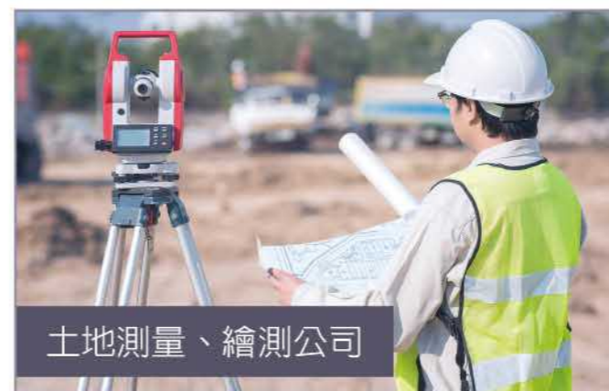
土地測量、繪測公司