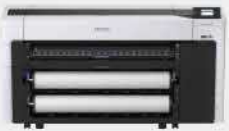
T7730D | 工程影像繪圖機