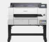
T3430 | A1繪圖機