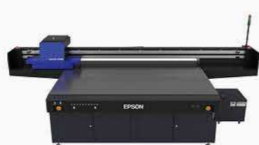
4x8 呎大尺寸平台式 UV 印刷機