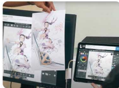
色彩管理分析應用研究 feat.臺藝大色彩實驗室