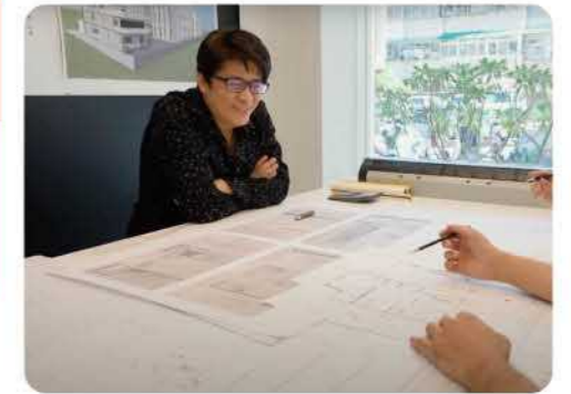
室內設計提案新利器