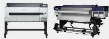
T5435 | 高效工程影像繪圖機 S60670L | 廣告大圖輸出機