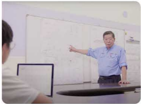
精細的遊艇設計圖 feat.大方船舶 x 般若科技