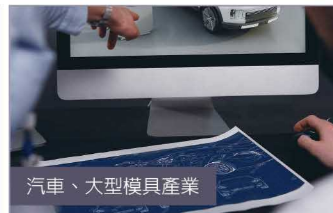
汽車、大型模具產業