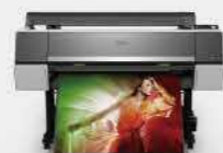
P9000 | 廣色域影像繪圖機