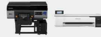
F3030 | 織品直噴印刷機 F530 | 熱昇華數位印表機