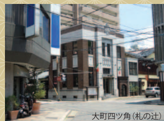
大町四ツ角(札の辻)

1590(天正18)年、会津に入った氏郷は黒川の地を「若松」と変え、屋根瓦に金を施した七層の天守閣を築きました。一方、若松城下を外堀によって町割りし、郭内には武家の住居を、郭外には町家や寺社を配置しました。大町四ツ角(札の辻)など中心市街地に見られるカギ型の十字路(食い違い)は、東西に緩やかに傾斜している城下の地形を利用し、生活用水を南北に分水