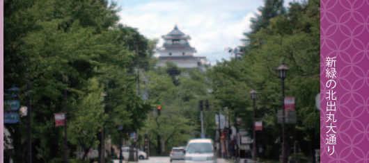
新緑の北出丸大通り