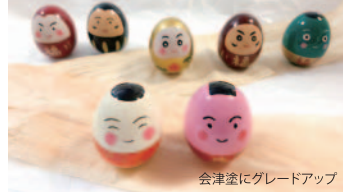
会津塗にグレードアップ

神社仏閣のメイン通りに面した、ものづくり体験館。会津塗・会津木綿・鶴ヶ城の樹木・会津の家紋を使用したメニューが大人気!子どもから大人まで年代別メニューが豊富。SDGs観光スポットに登録されています。