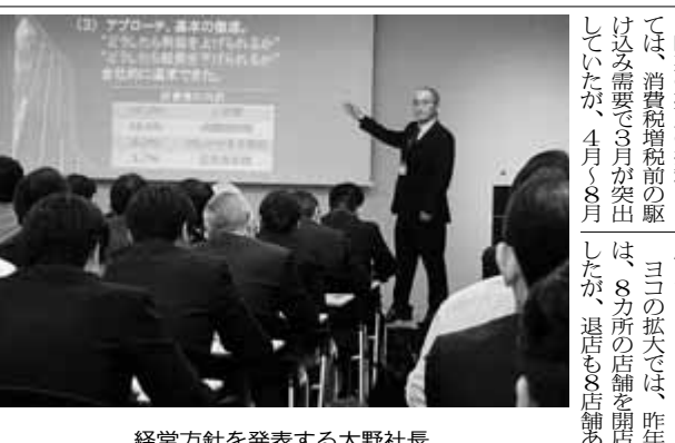
経営方針を発表する大野社長