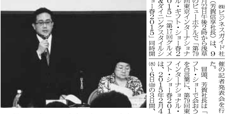
説明する芳賀社長(左)と芳賀会長(右)